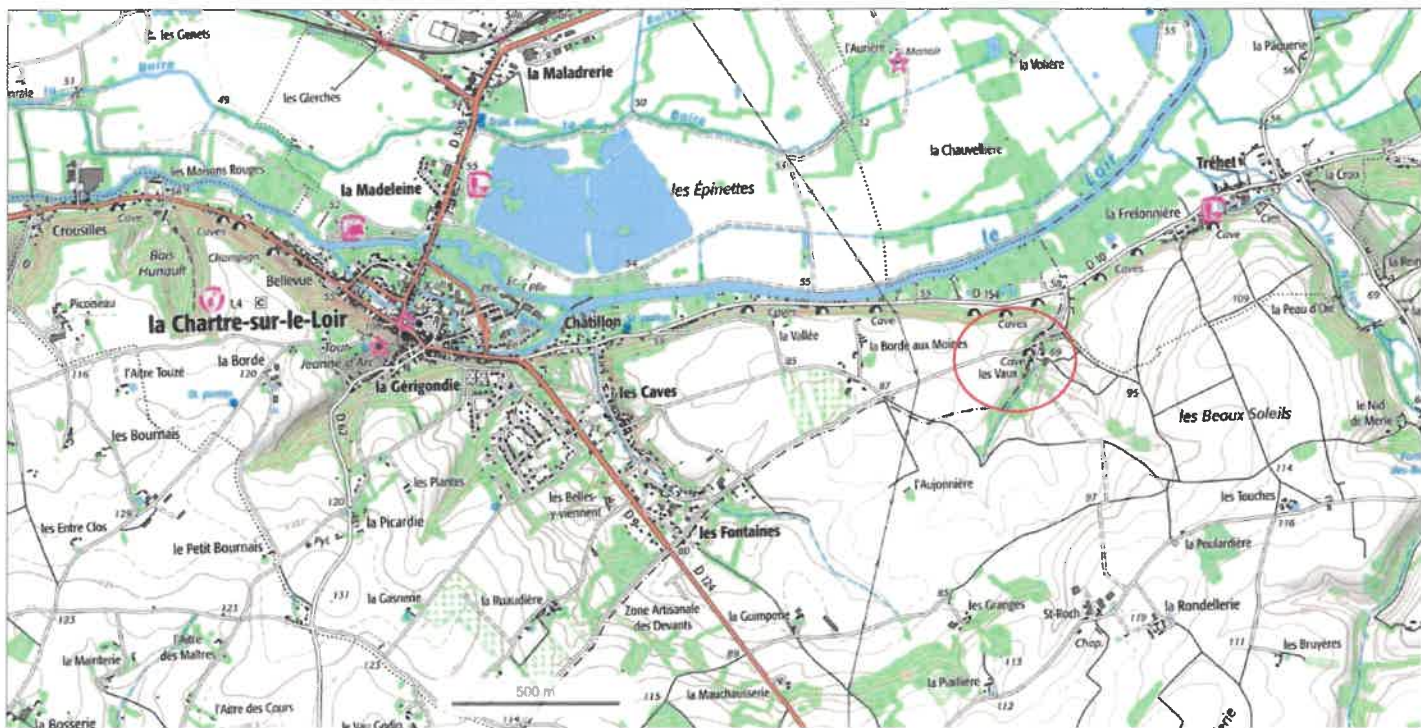
Localisation par rapport au centre-ville