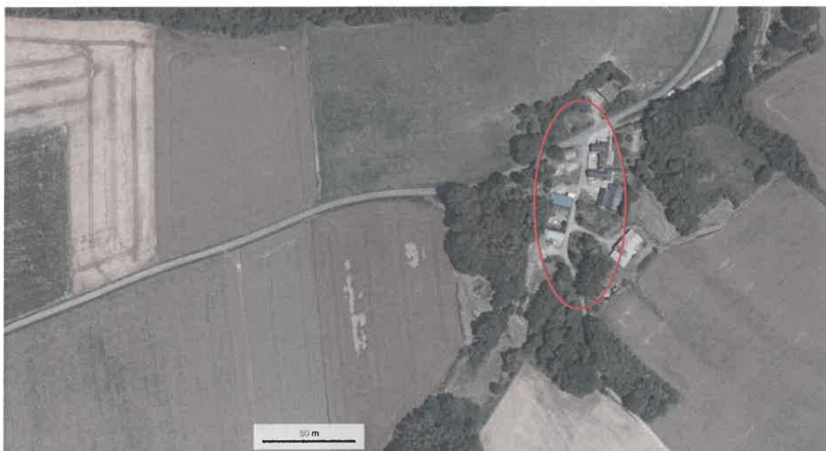
Lieu-dit « Les Vaux » - photo aérienne des habitations longeant le CR n°3